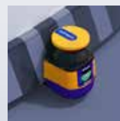
Escáneres Láser de Seguridad