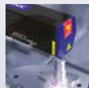
Sistemas de Marcaje Láser