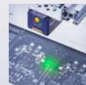
Escáneres Industriales Fijos