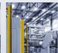
Cortinas de Seguridad