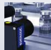
Sistemas de Visión